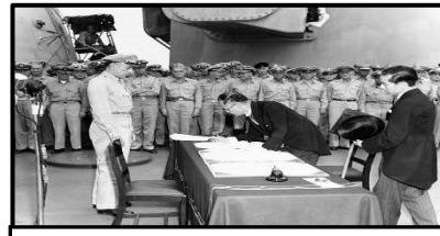
Firma de la rendición de Japón ante las fuerzas norteamericanas, septiembre de 1945.