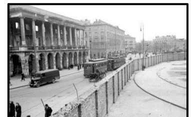
Gueto de Varsovia, Polonia