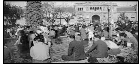
Los manifestantes refrescándose en la fuente de Plaza de Mayo, 17 de

Ante esa multitud, las autoridades militares debieron ceder y por la noche Perón volvió a la Casa de Gobierno, desde donde dirigió un discurso a las masas movilizadas. Ese día inició una nueva etapa en la historia argentina que tendría a los trabajadores como protagonistas centrales de la vida política.