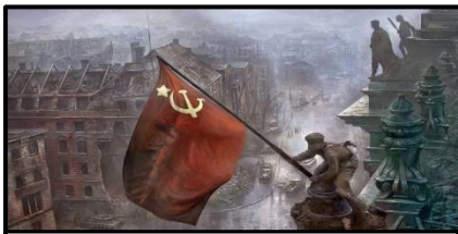
Un soldado soviético planta una bandera en la cima del Parlamento alemán, abril de 1945.