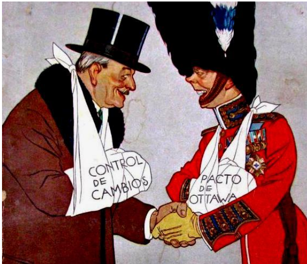
Julio Argentino Roca (hijo) y el Príncipe de Gales, en Londres, Caras y Caretas, 1933.

a) ¿A qué tratado, firmado entre Argentina e Inglaterra en la década de 1930, hace referencia la caricatura?