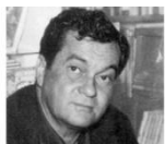
José Mauro de Vasconcelos. Un autor clásico.

En 1980 el autor de “Mi planta de naranja lima” vino a la Argentina para presentarse en la Feria del Libro. Los Andes lo entrevistó.